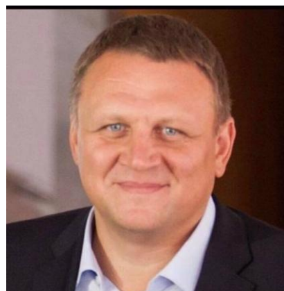
Народны Депутат Александр Шевчен