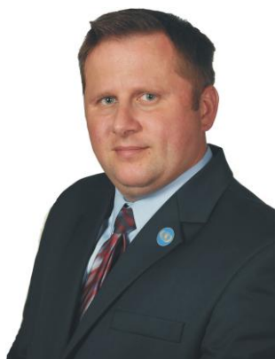
Генеральный секретарь Посол МКПЧ Рафал Марцин Васик